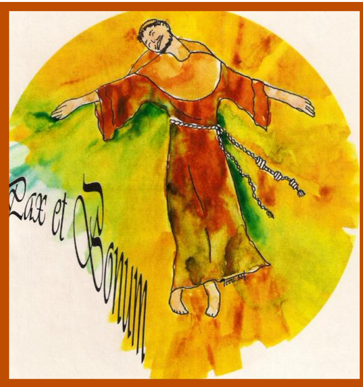
François qui danse, peinture de Terri Laurea, OSF

Finalement, c'est à travers l'imagination que l'expression de ce nouveau niveau de conscience se retrouve. Nous sommes la première génération à voir si clairement le rapport