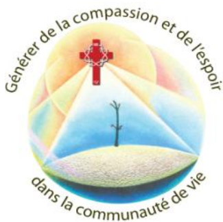
Illustration de Mary Southard, CSJ : Une nouvelle histoire Congrégation de Saint-Joseph de LaGrange Utilisation dûment autorisée (usage unique)