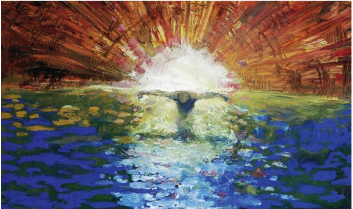
Le Baptême du Christ – de Daniel Bonnell (utilisation dûment autorisée)

nourrir – un membre d'une autre espèce. Je remarquais que la coopération était partout ! Hormis l'espèce humaine, les autres espèces semblent capables de vivre en coopérant entre elles afin que tout le monde puisse survivre et se développer. Pourquoi pas nous ?