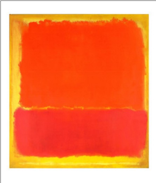
Mark Rothko, Senza titolo, 1951

Da quando il pensiero greco ha separato il mondo in mondo spirituale (costante, affidabile, non soggetto alla morte e alla distruzione) e in mondo materiale (sempre mutevole, inaffidabile, soggetto alla morte e alla distruzione), anche l'idea che gli esseri umani avevano di sé era intrinsecamente divisa (tra anima e corpo). Ci siamo trovati con una natura composta da un aspetto superiore e da un aspetto inferiore. Uno era da onorare e coltivare mentre l'altro da controllare, punire e persino da disprezzare.