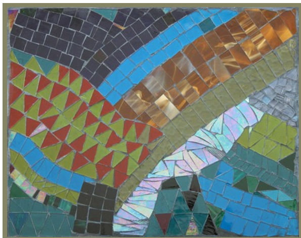
Gerome Kamrowski, "Energia remota" 2002

“Oggi andiamo scoprendo che la separazione è un’illusione e che definirci in base alle differenze ci rende incapaci di vedere la realtà della nostro essere-uno con il tutto.”