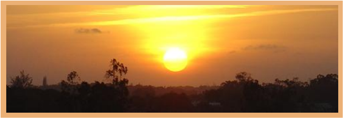
Tramonto a Camaragibe, Brasile

Sono convinta che abbiamo bisogno di costruire piccole comunità intorno ai bisogni più urgenti e immediati. Non si tratta più di fare “comunità per fare comunità”, anche se possiamo certamente accogliere e promuovere il valore della vita di comunità. Ma se non c’è un obiettivo comune corriamo il rischio di chiuderci e, un po’ alla volta, di distruggerci nelle difficoltà più banali o nelle complicazioni della vita quotidiana. Non sto necessariamente parlando delle comunità religiose; tuttavia non escluderei che abbiano bisogno di rivedere i loro obiettivi di comunità.