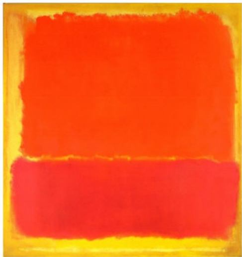
Mark Rothko, Sem Título , 1951

A religião manteve a primazia do espírito. Quanto mais próximo o modo de viver de uma pessoa estivesse do âmbito espiritual, mais alto ela poderia se considerar na escala da perfeição. O medo do próprio corpo, com seus anseios e apetites, muitas vezes conduziu as pessoas a odiá-lo e a sentir aversão por ele. A maior parte da literatura religiosa do passado estimulava essa linha de pensamento. A geral ansiedade com relação à sexualidade e a conseqüente misoginia dominante no cristianismo (e também no islamismo) se fundamentam nesse dualismo. A superioridade da vida religiosa e do sacerdócio sobre a vida matrimonial, a ênfase em atos de mortificação da carne visando controlar impulsos físicos, o horror à nudez nas artes, e mesmo o desdém para com o trabalho braçal, do qual devemos nos abster o quanto possível um dia por semana, são atitudes arraigadas no abismo criado pela visão dualista do mundo.