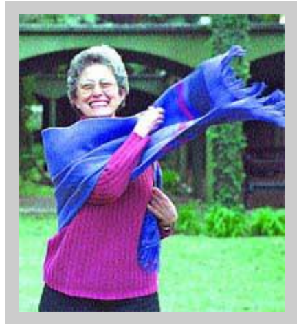
Ivone Gebara, SP

Esta conversação é com Ivone Gebara, SP, uma brasileira Irmã de Nossa Senhora (Canonistas de Sto. Agostinho), que é uma das teólogas líderes da América Latina. Autora de Ansiando por Água Corrente: Eco-