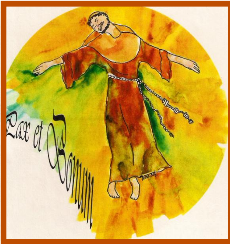
"Francisco Dançando" de Terri Laurela, OSF

A contemplação é um conceito intimamente relacionado à amplidão. De fato, poderíamos dizer que a amplidão provém da contemplação, a qual é, essencialmente, a nossa capacidade de ver. “Olhar longamente e com amor para aquilo que é real” é uma antiga definição de contemplação. Hoje em dia, agimos muitas vezes num ritmo tão acelerado e tão cheios de julgamentos prévios que nem conseguimos ver aquilo que temos diante de nós! Costumo promover a meditação por ser uma prática capaz de nos desacelerar, de nos abrir e de nos ensinar o que é real, tanto no interior de nós mesmos como à nossa volta. É justamente a prática da meditação que nos permite sermos contemplativos.